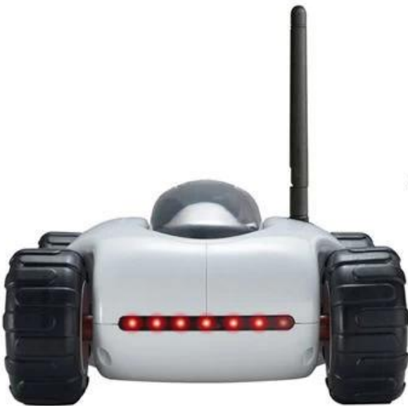
Charging And Running Led Indicator