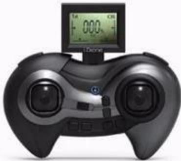
with LCD transmitter x1