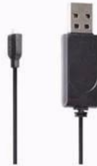
universal USB charging line x1